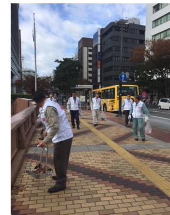
写真の説明：清掃活動