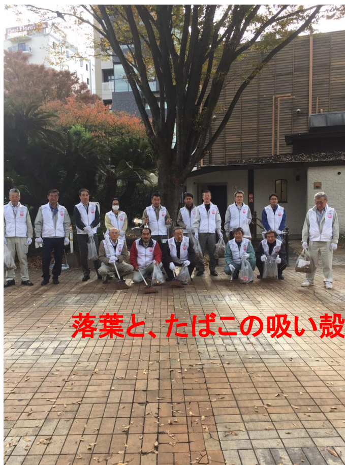
落葉と、たばこの吸い殻