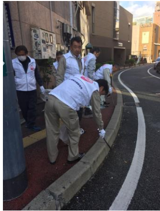
写真の説明：清掃活動