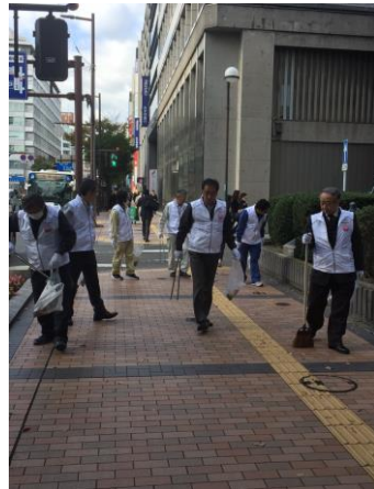
写真の説明：清掃活動