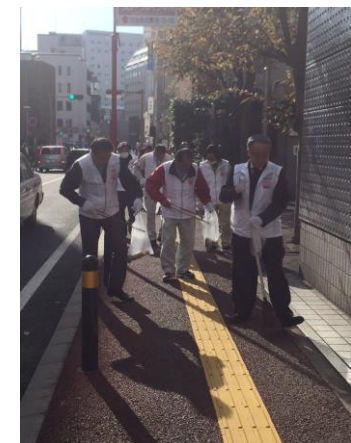
写真の説明：清掃活動